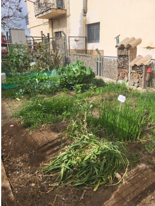
Grădina de zarzavaturi și legume